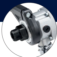
ATTACCO MACCHINA M30