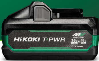
BSL3640MVT NAVATON T-PWR AKKU