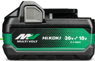
BSL36A18X MULTI VOLT AKKU