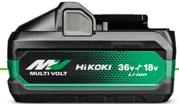
BSL36B18X MULTI VOLT AKKU