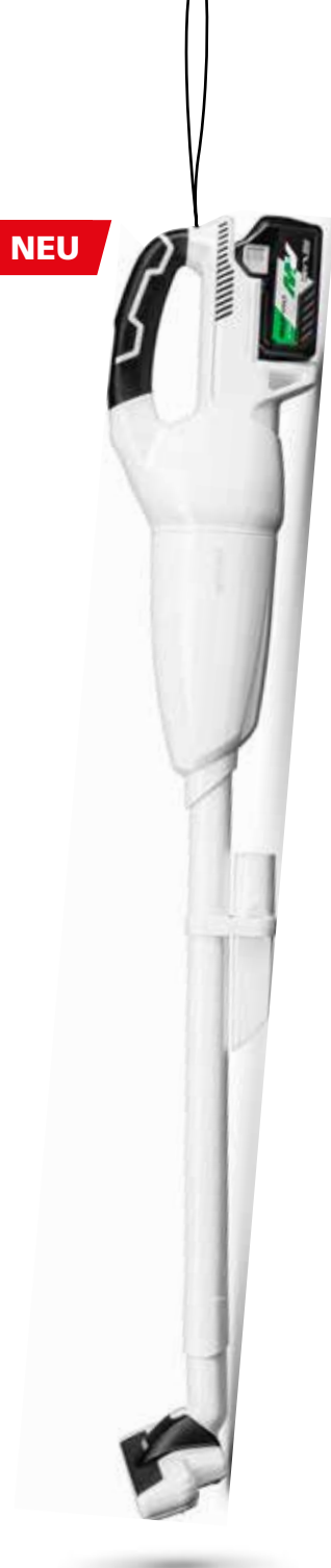
Akku Staubsauger R36DB