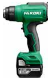
Akku Heißluftpistole RH18DA