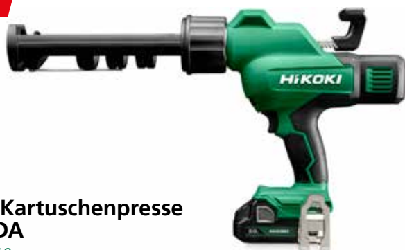
Akku Kartuschenpresse AC18DA