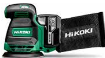
Akku Exzentrerschleifer SV1813DA