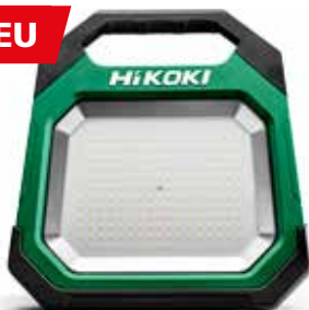
Akku Baustellenstrahler UB18DD