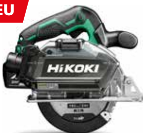
Akku Metall-Handkreissäge CD3605DB