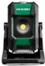
Akku Baustellenstrahler UB18DB