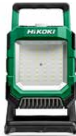
Akku Baustellenstrahler UB18DC