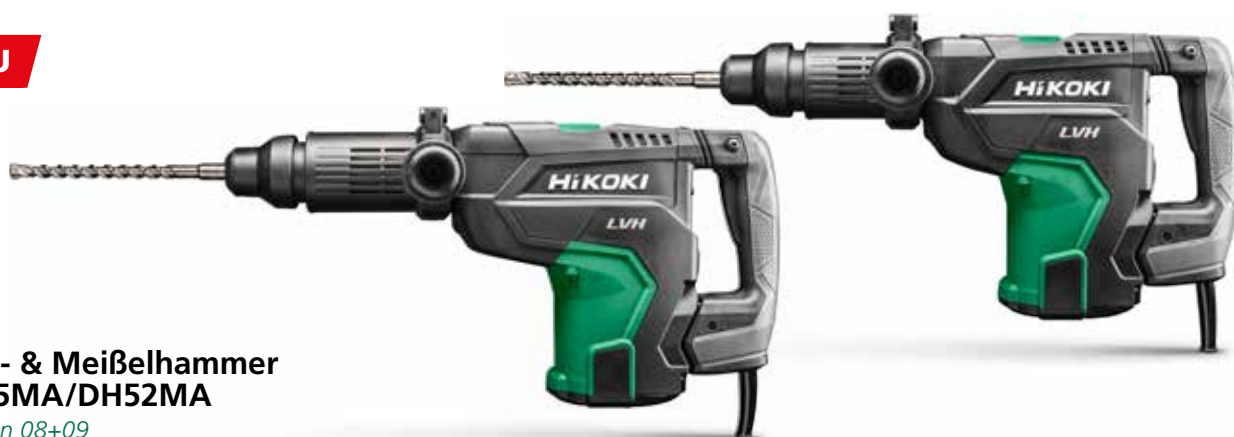
Bohr- & Meißelhammer DH45MA/DH52MA