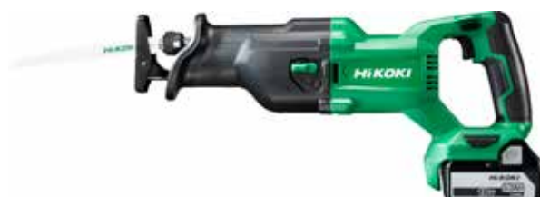
Akku Tigersäge CR18DB