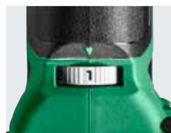
Variable Hubzahlwahl mit 6 Geschwindigkeiten.

2 Akkus BSL1225M 10,8V (2,5 Ah) Li-ion - 1 Ladegerät UC12SL - 1 Schlüssel - 8-tlg. Zubehör Set (1x Schleifplatte, 5x Schleifpapier, 2 Sägeblätter) - 1 Transportkoffer